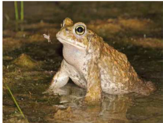
Erdkröte ( Bufo bufo )