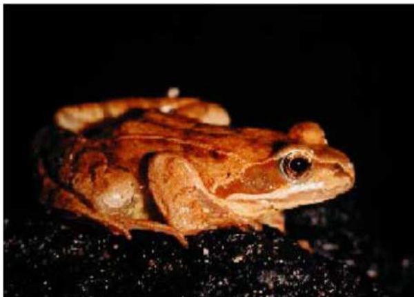
Grasfrosch ( Rana temporaria )